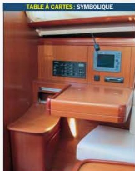
TABLE À CARTES: SYMBOLIQUE